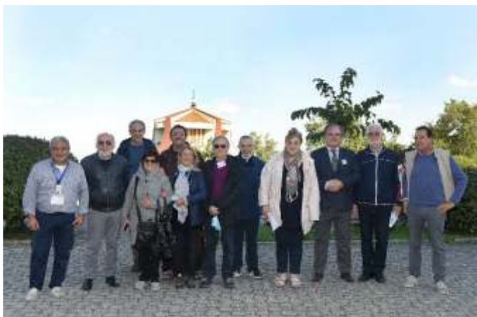
3° Direttivo AIASM uscente anni 2019-2022

La maggior parte degli incontri avvierai remoto via zoom, tuttavia sono raccomandati almeno 3 o 4 incontri dal vivo in luoghi da concordare. Due possono essere seminario internazionale di Medjugorje e il nostro nazionale.