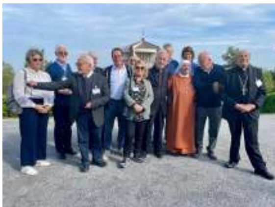
Il direttivo AIASM